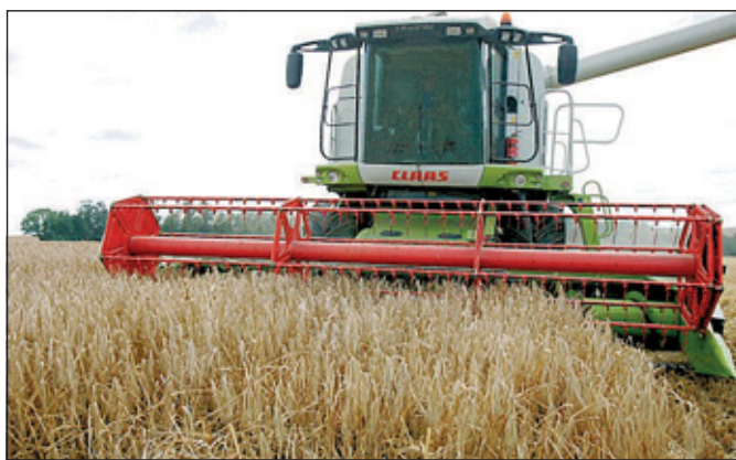
La hausse des cours des céréales est accusée à tort de la hausse des prix de l'alimentaire.