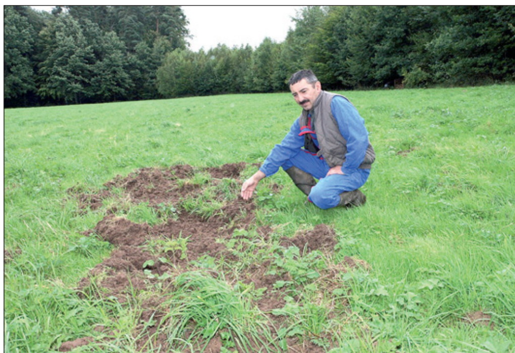
Face au problème récurrent des dégâts causés par les sangliers, les agriculteurs affichent un profond ras-le-bol et menacent d'entrer dans une nouvelle phase d'action.